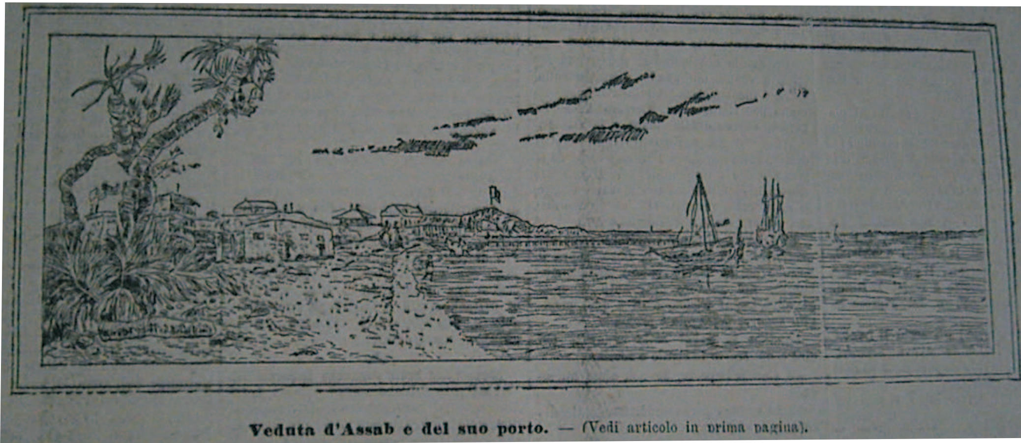
Veduta d'Assab e del suo porto. — (Vedi articolo in prima pagina).