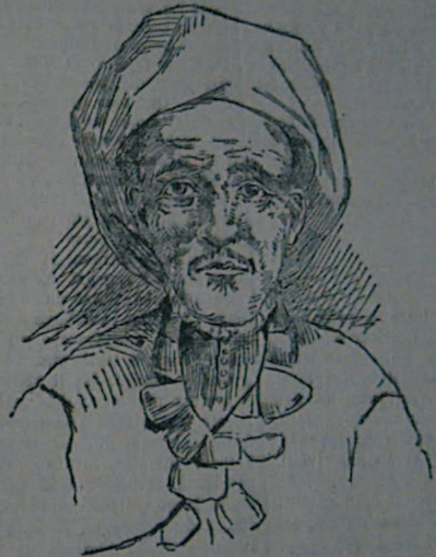
Berehan, sultano di Raheita.